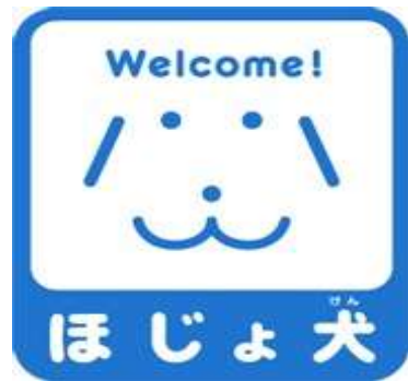
けん 【ほじょ犬マーク】

しんたいしょうがいしゃほじょけんほう けいはつ 身体障害者補助犬法の啓発のためのマークで す。