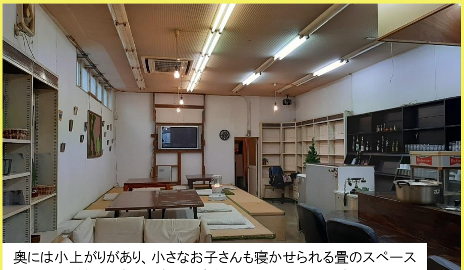
奥には小上がりがあり、小さなお子さんも寝かせられる量のスペースがあります。10名ほど座れるようになっています。