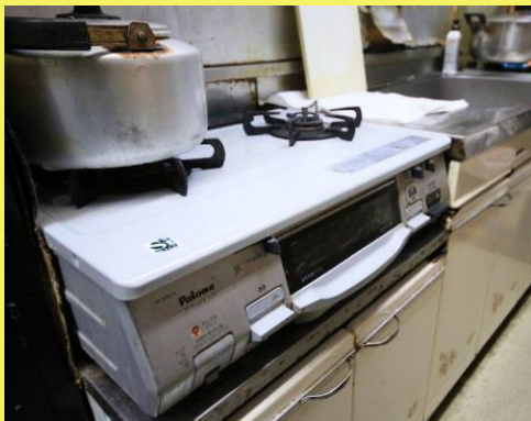
ニロコンロが2台あり、計4つのフライパンを置けます。