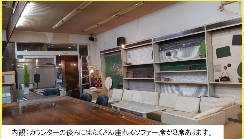
内観：カウンターの後ろにはたくさん座れるソファ席が8席あります。