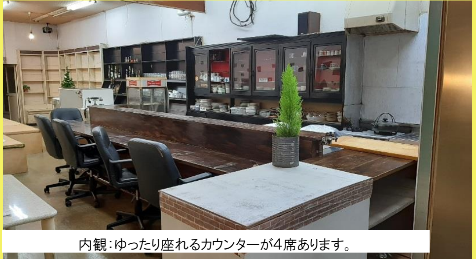
内観：ゆったり座れるカウンターが4席あります。