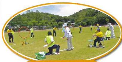
フライングディスク