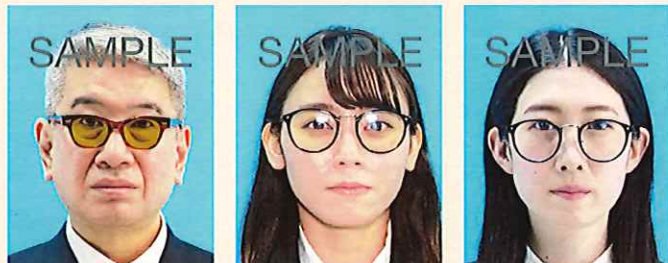
色付きの眼鏡やサングラス

より確実な本人確認のため、眼鏡を外した顔写真を推奨します。眼鏡を着用するとき、色付きのレンズや反射・影があるものは不適当です。また、目を妨げる縁・フレームがないものに限ります。医療上必要とされない限り、サングラスや処方のない色付きの眼鏡は不適当です。