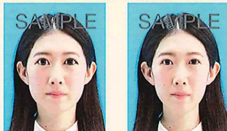
目を大きくしたり、顔のパーツが変形したもの

目を大きく見せたり、美白処理、顔パーツやほくろ、しわなどを修正するなどして、本人のイメージを変えることは、いかなる場合でも不適当です。また、左右反転※した写真は不適当です。