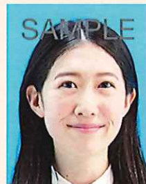
口角が上がるなどにより実際の容姿と著しく異なるもの