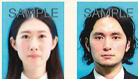
ピンぼけや手ぶれにより不鮮明なもの

撮影時にピントが合っていないかったり、手ぶれしてしまったため不鮮明なものや、顔にたかりやムラがあるものは不適当です。