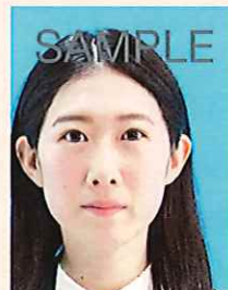
位置が片寄っているもの