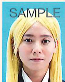
カツラ(ウィック)などにより実際の容姿や雰囲気が変わるもの