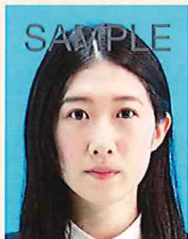
顔の輪郭が隠れるもの