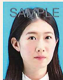
横を向いているもの