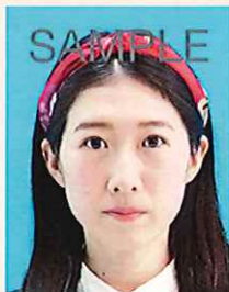
帽子やヘアバンドなどにより顔の一部が隠れているもの