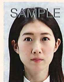
背景が柄模様であったり、凹凸のあるクロスが写りこんでいるもの