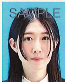
髪が目にかかっているもの