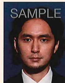
背景の色が濃いもの