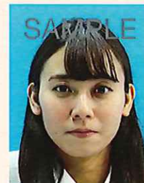
背景に異物が写りこんでいるもの