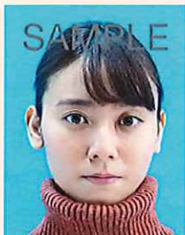
タートルネック、パーカーのフード、首を覆うもの、衣服などにより顔などの顔の一部が隠れているもの