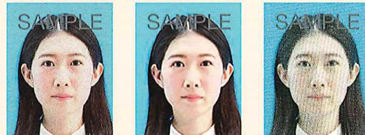
ノイズ(画像の乱れ)があるもの

デジタル画像の過剰な圧縮などが原因となってノイズ(画像の乱れ)が発生しているものや、ジャギー(階段状のギザギザ模様)、印刷時のドット(網状の点)やインクのにじみがあるものは不適当です。写真専用の用紙を使用し、鮮明な画質で印刷してください。