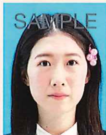
装飾品で目・鼻・唇などが隠れているもの