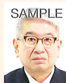
頭、髪、服装等と背景の境界が不明瞭なもの